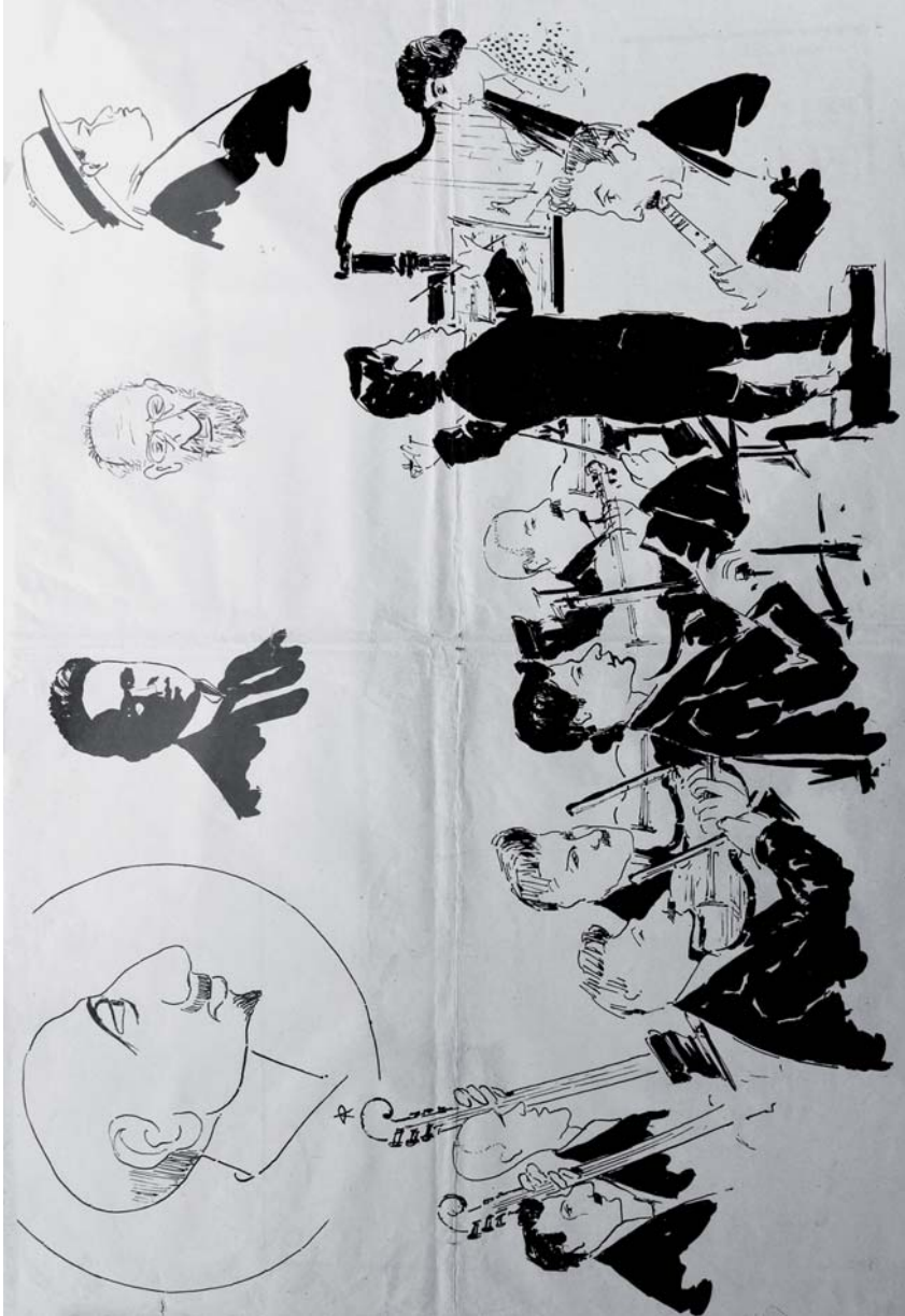
Fig. 6. Caricatura pubblicata in «il 2 agosto», numero unico, Pesaro 1914 (Biblioteca Civica Rovereto).