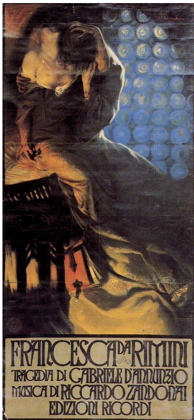
Fig. 3. Cartolina dal manifesto pubblicitario di Giuseppe Palanti.