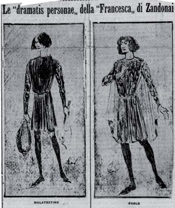
Fig. 7. Caramba, Figurini per Francesca da Rimini , prodotti per «L'Ora» di Pesaro (s.d.) (Biblioteca Civica Rovereto).