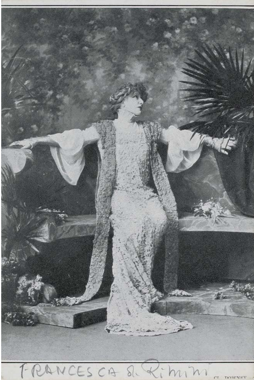
Fig. 4. Sarah Bernhardt in Francesca da Rimini di F.M. Crawford (1902).