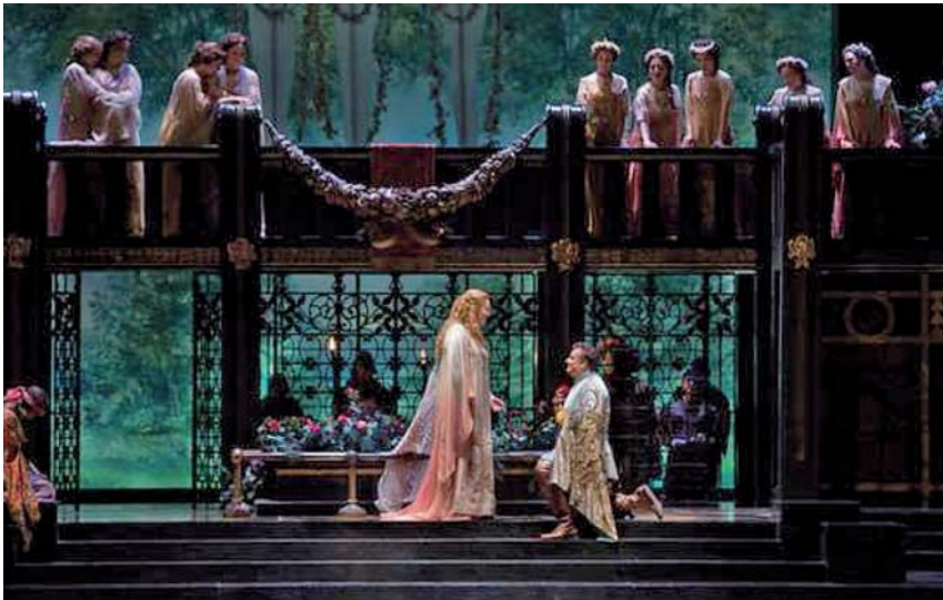
Fig. 11. Francesca da Rimini , atto I (New York, 2013)