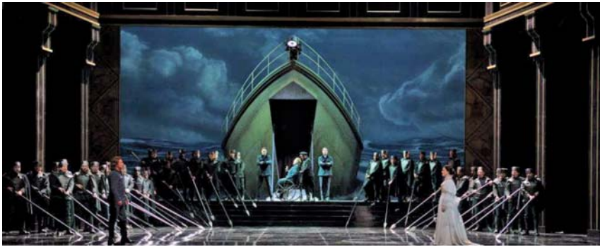
Fig. 10. Francesca da Rimini , atto I e atto II (Parigi, 2011).