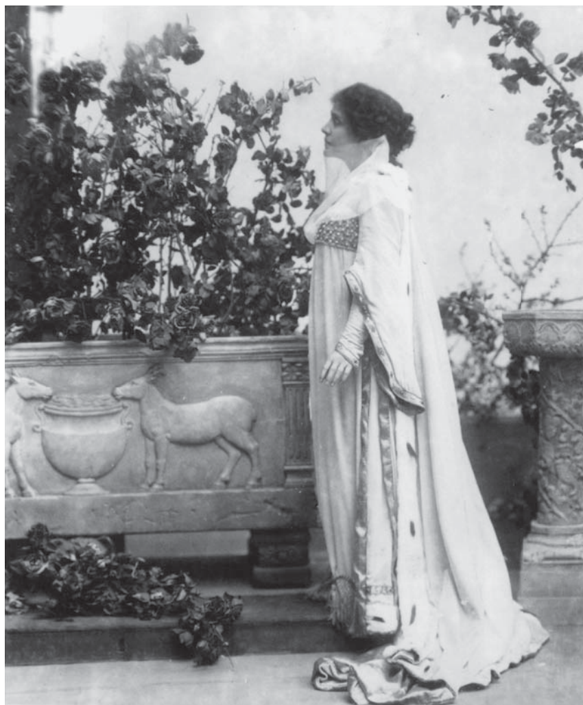
Fig. 5. Eleonora Duse in Francesca da Rimini (1901).