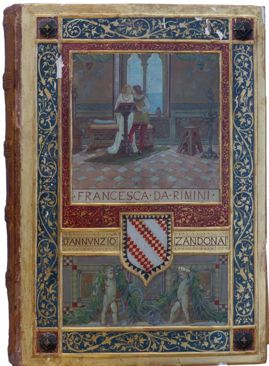
Fig. 1. Copertina della Partitura sintetica (manoscritto originale) (Biblioteca Civica Rovereto).