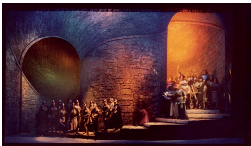
Fig. 9. Pierluigi Samaritani, scenografia per Francesca da Rimini , atto I e atto II (Verona, 1980). (Archivio Samaritani, Istituto per il Teatro e il Melodramma, Fondazione Giorgio Cini di Venezia).