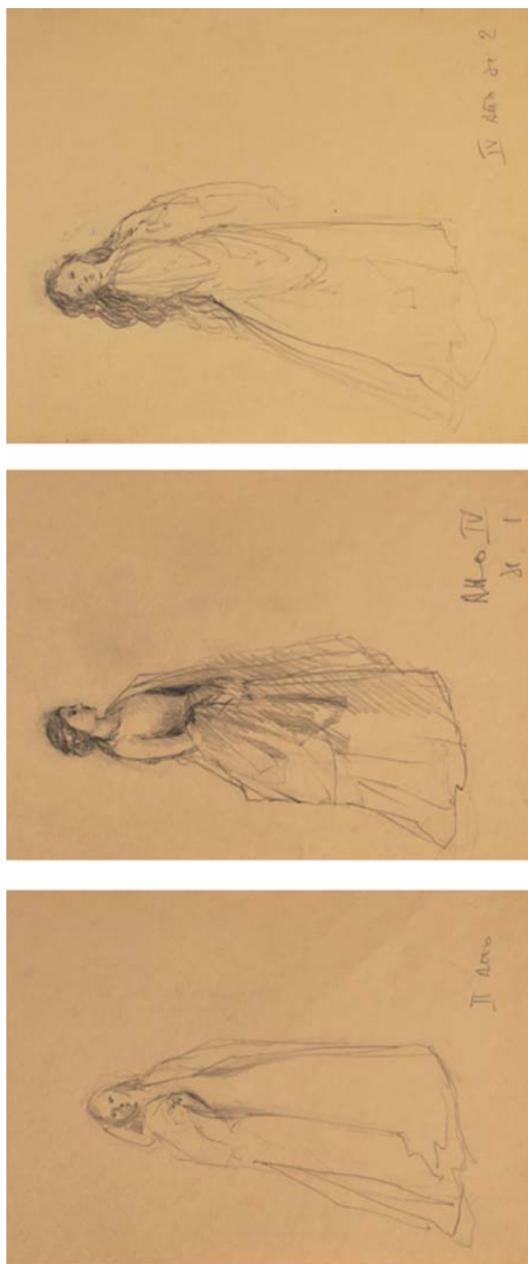
Fig. 8. Pierluigi Samaritani, bozzetti di figurini per Francesca da Rimini (Verona, 1980). (Archivio Samaritani, Istituto per il Teatro e il Melodramma, Fondazione Giorgio Cini di Venezia).