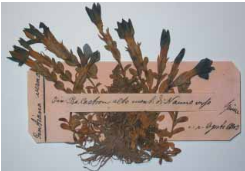
Fig. 6. Gentiana verna raccolta a Pra Castron (Brenta settentrionale).