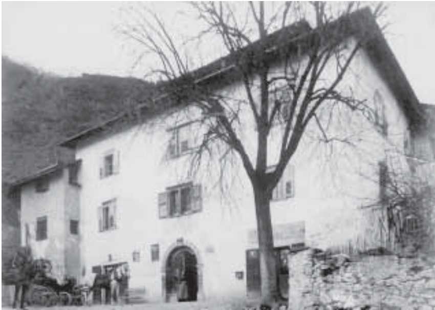
Fig. 2. Casa Podetti a Piano, primi del '900. Il gabinetto di scienze naturali di Giovanni Podetti era collocato nell'ala separata (a sinistra nella foto) e vi si accedeva dall'interno della casa: le finestre del locale sono quelle del primo piano.

no conservate (ormai quasi completamente perdute) comprendevano sicuramente reperti: