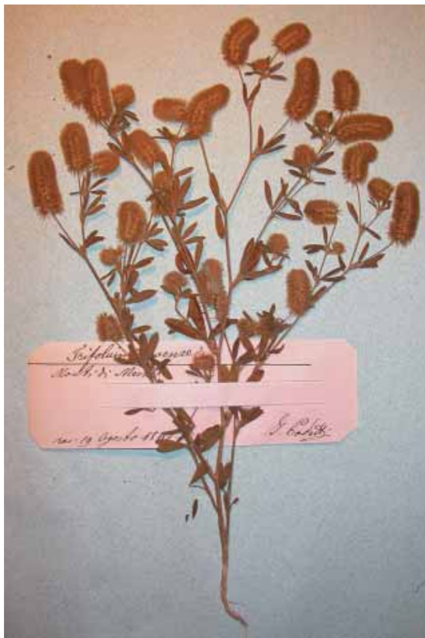
Fig. 4. Uno dei pochi fogli d'erbario con un solo campione, in questo caso Trifolium arvense .