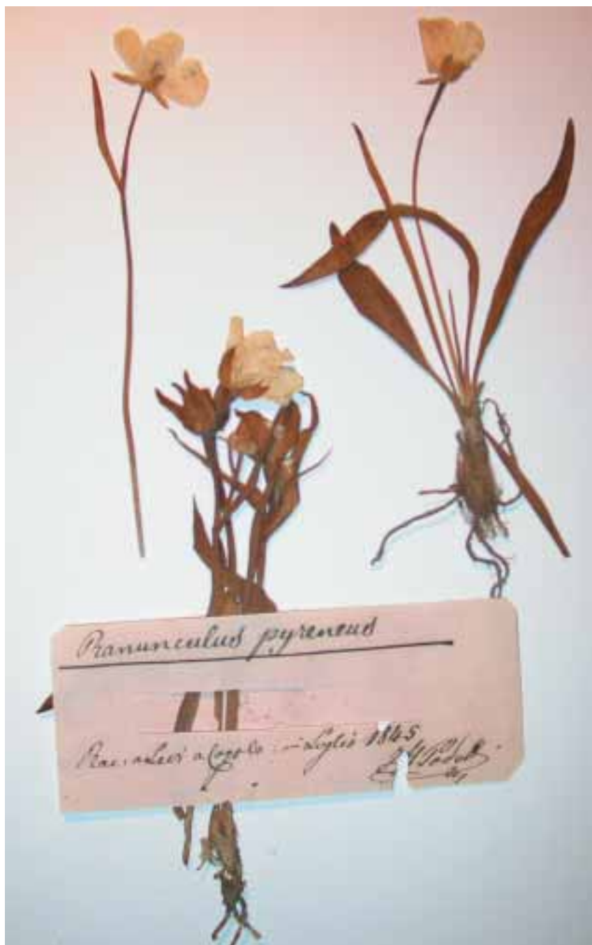
Fig. 9. Ranunculus pyrenaicus dal Monte Levi di Cogolo.