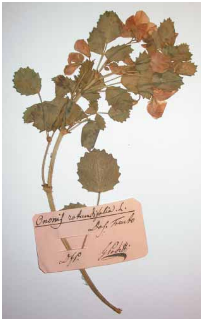
Fig. 7. Ononis rotundifolia , raccolta nella nota stazione di Doss Trento.