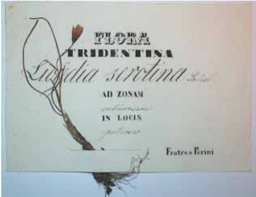
Fig. 5. Campione con cartellino a stampa, proveniente dalle raccolte dei fratelli Agostino e Carlo Perini.