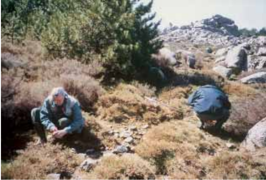
Fig. 7. Due degli autori intenti alla ricerca in un rigagnolo poco a valle della sorgente (Monte Limbara, loc. Madonna della Neve).