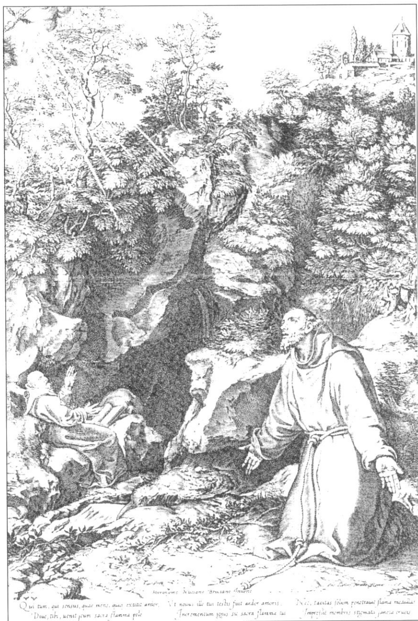
Fig. 5 - Cornelis Cort (da Girolamo Muziano) San Francesco riceve le stimmate .