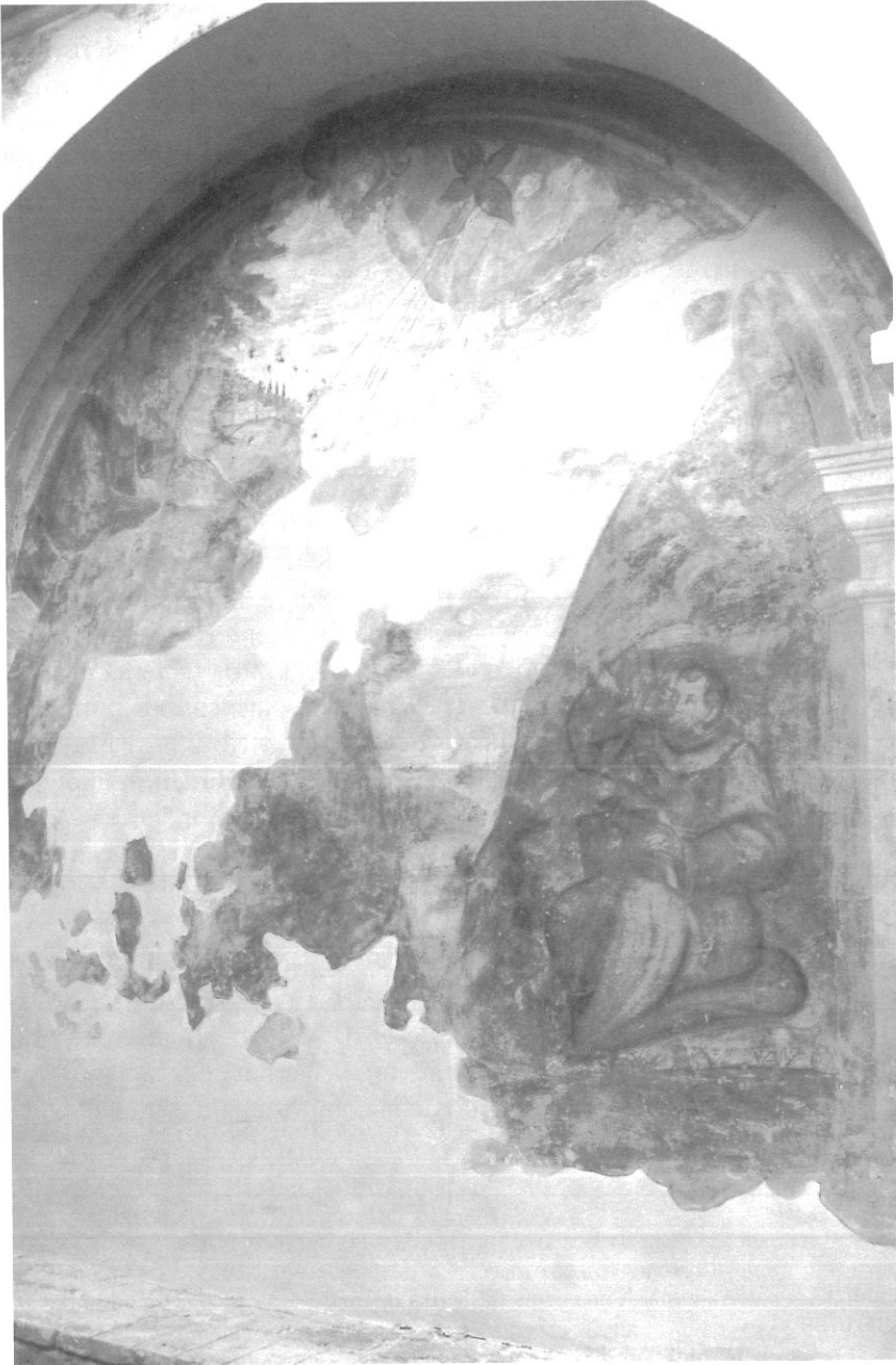
Fig. 4 - L'affresco raffigurante la Stigmatizzazione di San Francesco nel Chiostro della Porta.