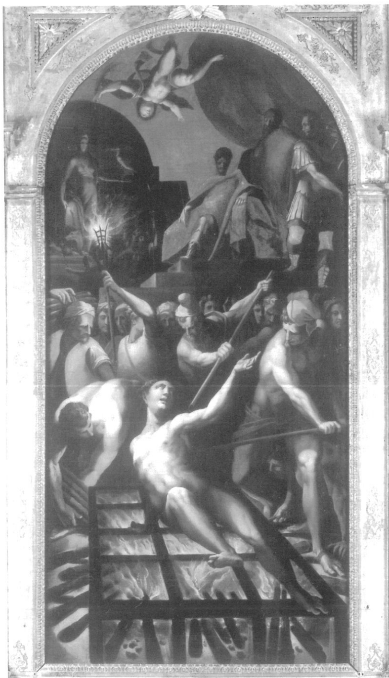
Fig. 1 - Lorenzo Costa il Giovane, Il martirio di San Lorenzo , Santuario della Beata Vergine delle Grazie, Curtatone (Mantova), Cappella Bertazzolo.