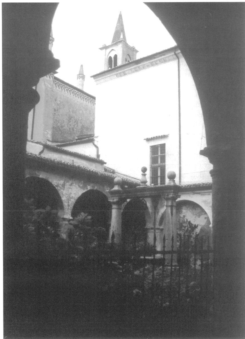
Fig. 3 - Il Chiostro della Porta nel complesso del Santuario della Beata Vergine delle Grazie presso Mantova dove si trovano gli affreschi con le storie di san Francesco. Nell'arco tamponato alle spalle del pozzo è la Stigmatizzazione .