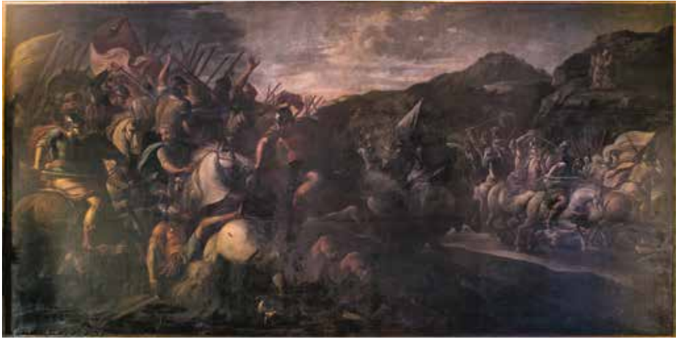
VII. Anonimo veneto, Giosuè che combatte gli Amaleciti . Rovereto, palazzo Bossi Fedrigotti.