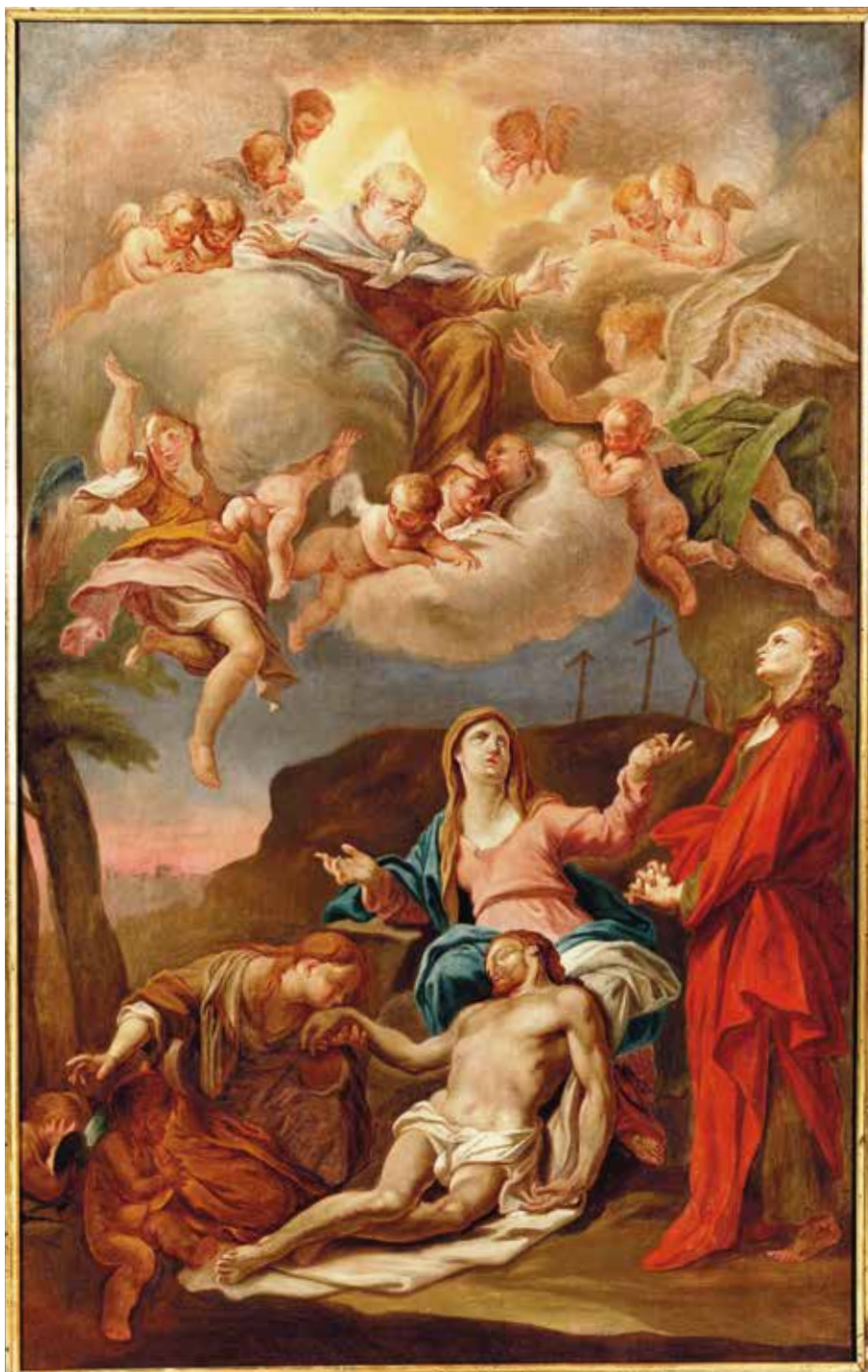
XV. Pittore romano (da Francesco Trevisani), Compianto su Cristo morto . Rovereto, Casa Rosmini.