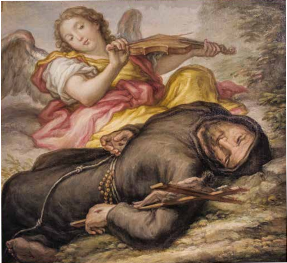
X. Gaspare Antonio Baroni Cavalcabò, Estasi di san Francesco . Brescia, Pinacoteca Tosio Martinengo.