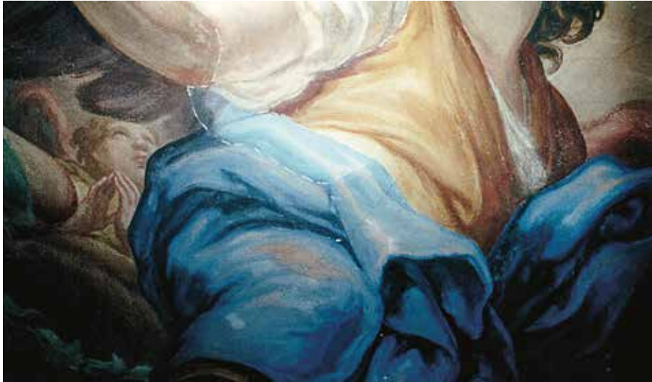
XIII. Sacco (Rovereto), chiesa di San Giovanni Battista, prova di pittura del manto di un angelo, volta della navata maggiore della chiesa di San Giovanni Battista.