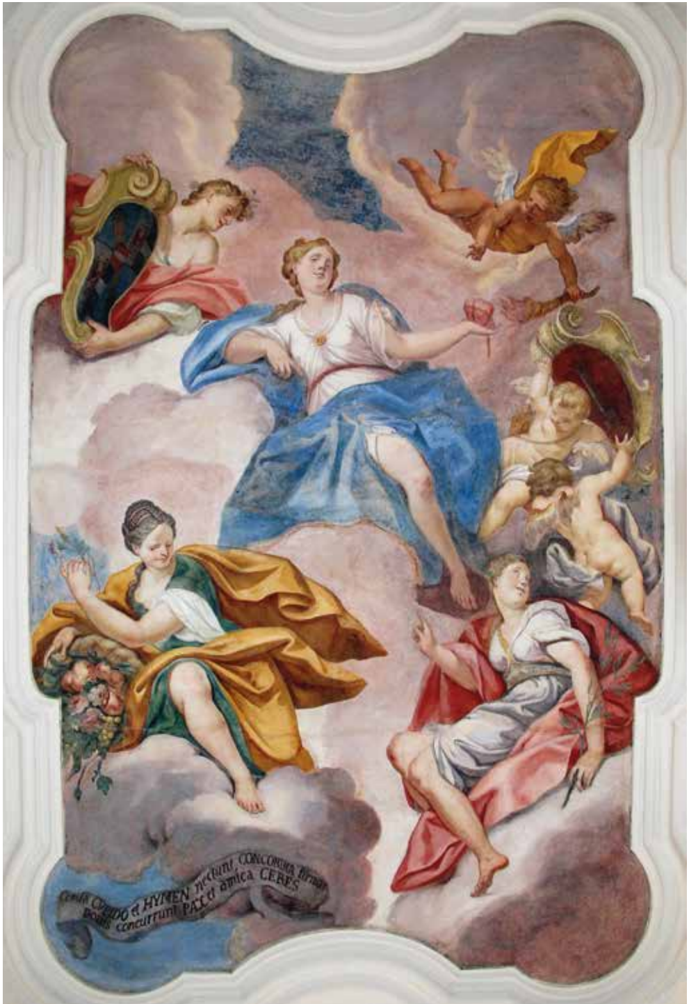
II. Antonio Gresta, La Concordia coniugale con Imeneo, la Pace e Cerere , 1726 circa. Trento, palazzo Thun Menghin.