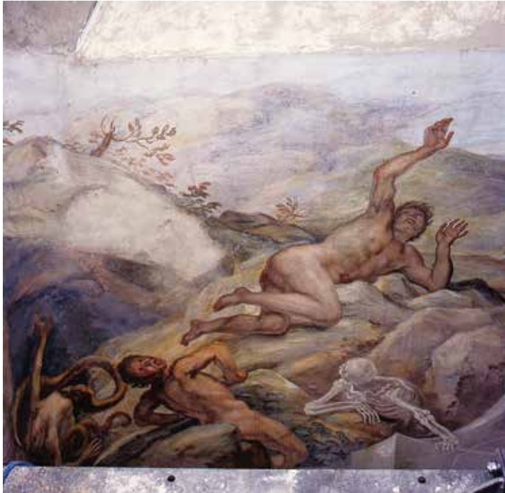
XIV. Gaspare Antonio Baroni Cavalcabò, Giudizio finale – i dannati , 1754 circa. Sacco (Rovereto), chiesa di San Giovanni Battista, Paradisetto .