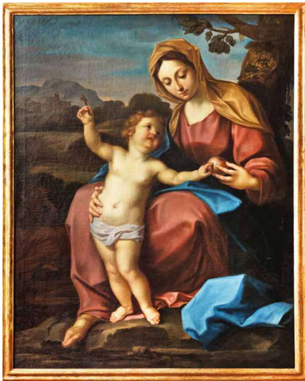
XVI. Odoardo Vicinelli, Madonna con Bambino . Rovereto, Casa Rosmini.