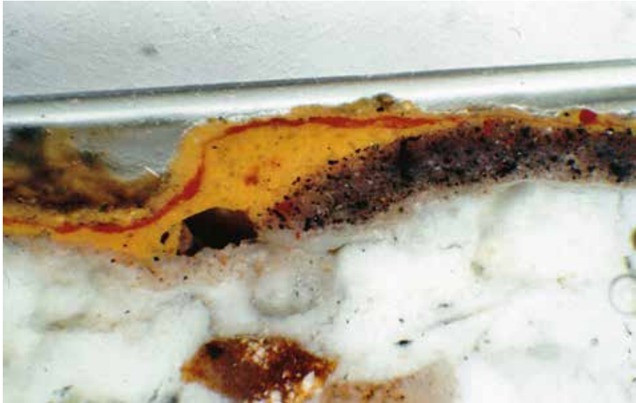
XI. Sacco (Rovereto), chiesa di San Giovanni Battista, analisi degli intonaci degli affreschi della volta (1749). Immagine al microscopio della sezione stratigrafica relativa al pigmento giallo del manto di un angelo.