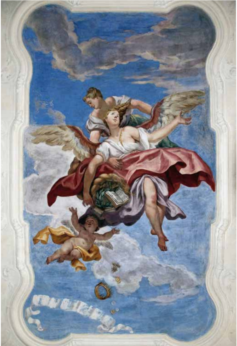
III. Antonio Gresta, La Fortuna dispensa onori e ricchezze , 1726 circa. Trento, palazzo Thun Menghin.