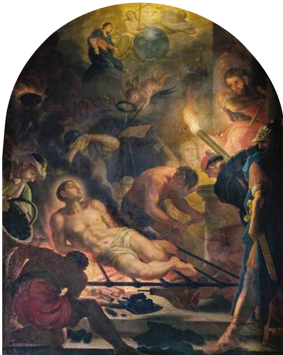
IV. Gaspare Antonio Baroni Cavalcabò, Martirio di san Lorenzo . Por, chiesa di San Lorenzo.