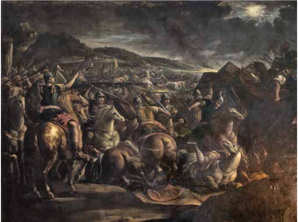
VIII. Anonimo veneto, Giosuè che ferma il sole . Rovereto, palazzo Bossi Fedrigotti.