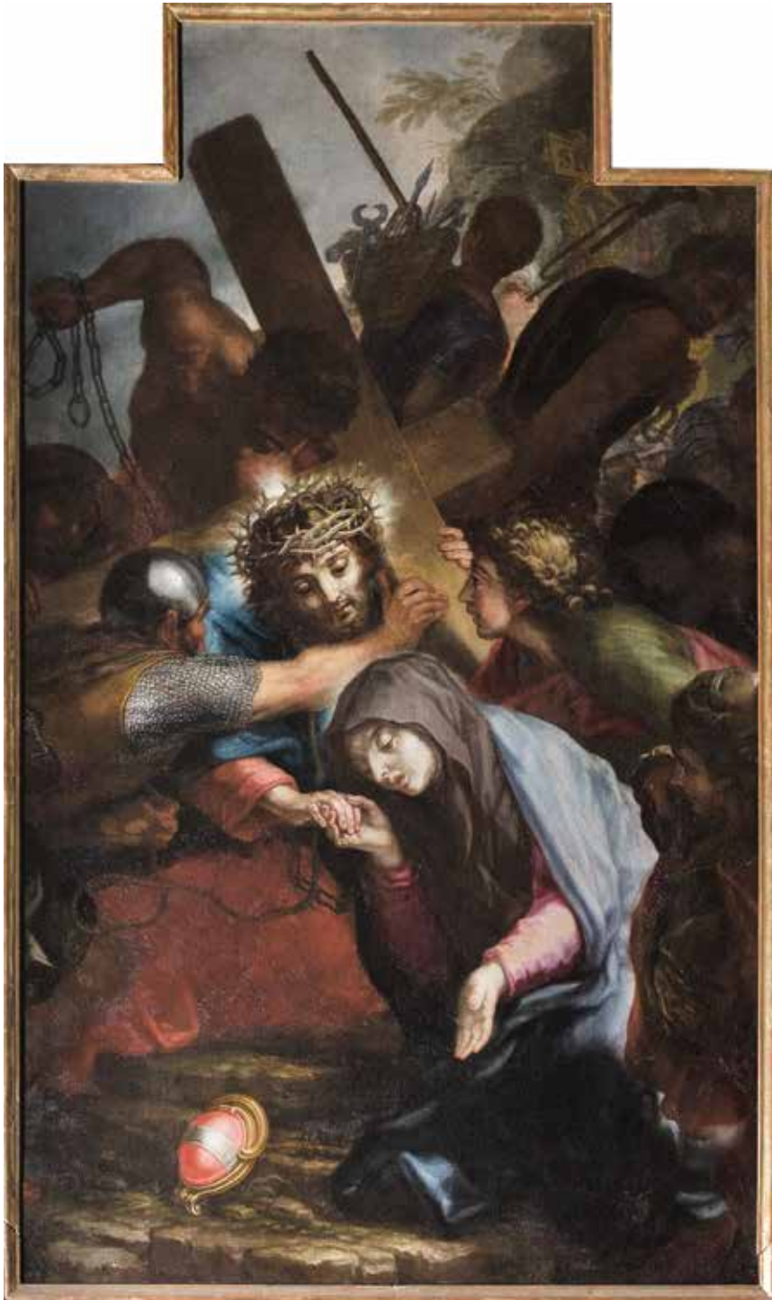
VI. Gaspare Antonio Baroni Cavalcabò, Spasimo , 1733. Sacco (Rovereto), chiesa di San Giovanni Battista.